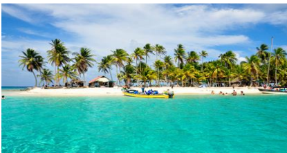
Islas de San Blas