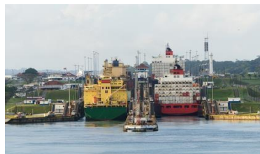
Canal de Panamá